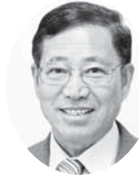
植木こうじ 都議会議員