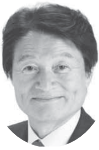
建設委員会 副委員長