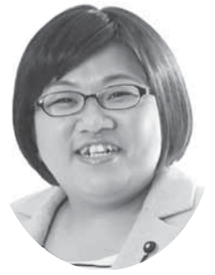
厚生委員会 委員長